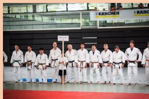
Ein Damenteam kämpft in der Landesliga.

Wir betreiben Judo zum Spaß und wollen nicht Olympiasieger werden. Trotzdem haben wir regelmäßig ein anspruchsvolles Training. Wir kämpfen derzeit mit einer Herren-Mannschaft in der Landesliga und mit einer weiteren in der Bezirksliga.