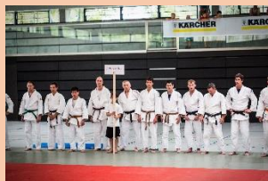
Ein Damenteam kämpft in der Landesliga.

Wir betreiben Judo zum Spaß und wollen nicht Olympiasieger werden. Trotzdem haben wir regelmäßig ein anspruchsvolles Training. Wir kämpfen derzeit mit einer Herren-Mannschaft in der Landesliga und mit einer weiteren in der Bezirksliga.